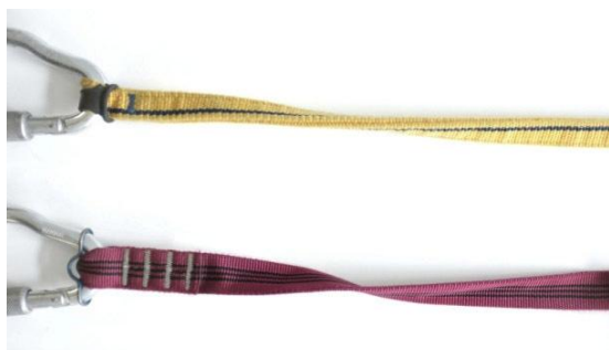
Bracci non elastici - Non oggetto richiamo

CAI, Centro Studi Materiali e Tecniche, 1 Settembre 2012